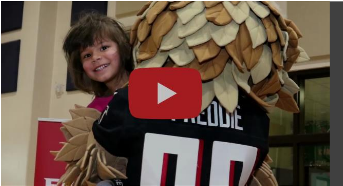
Falcon Friday à Peachcrest Elementary School

https://www.youtube.com/watch?v= J4UnJi-6X0