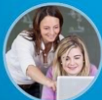
معلم مجاز 35 دلار در ساعت