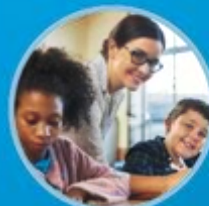
رهبر مرکز مهارت های تحصیلی پاراپروفشنال تمام وقت