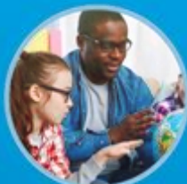
معلم غیر مجاز 18 دلار در ساعت